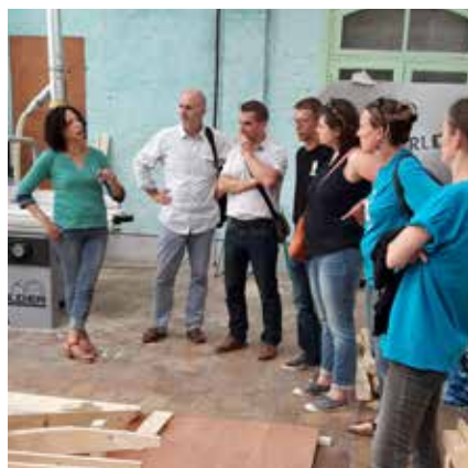
Visite Fibre n Co