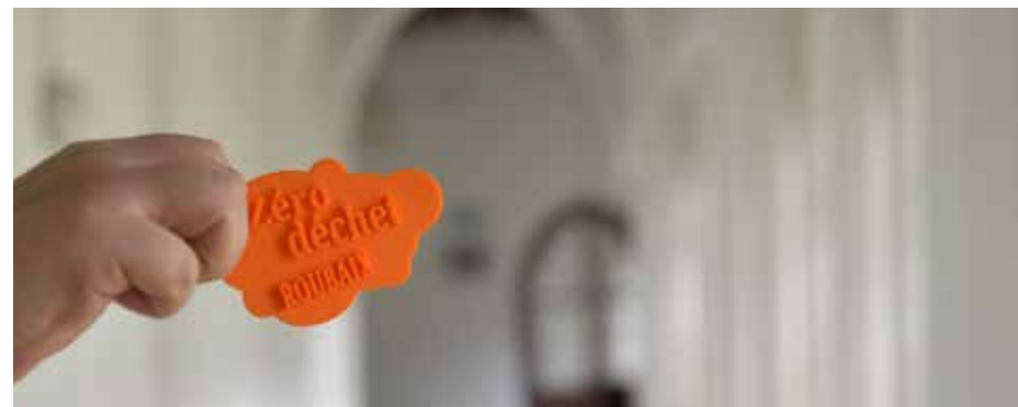
Visite du Couvent des Clarisses